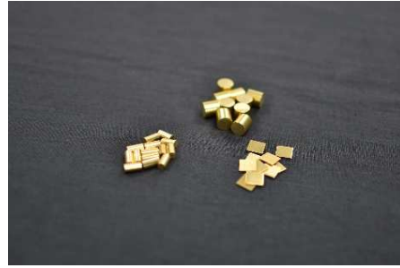
真空蒸着材 丸棒タイプ、プレートタイプ等