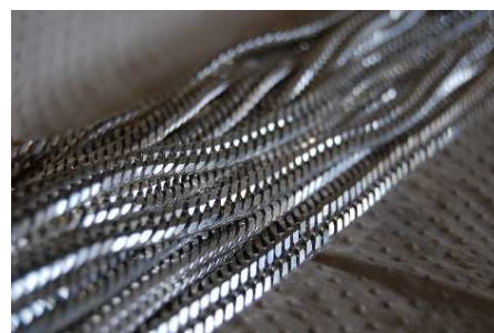
マシンチェーン (チタン) キヘイ、ヘリンボーン等