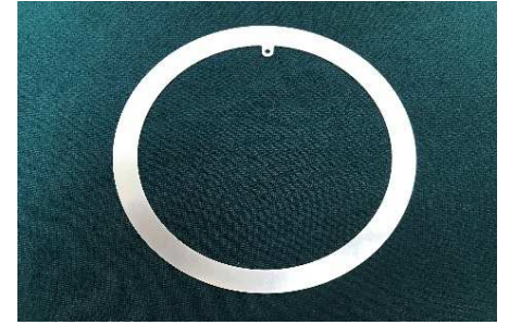
スリップリング材 スリップリング用リング材