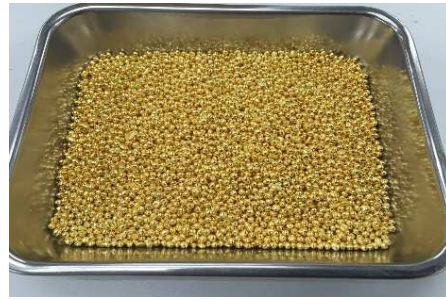
Au (金) ショット 蒸着用高純度ショット